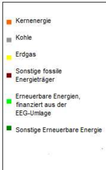
Gesamtstromlieferungen des Unternehmens

Angaben auf der Basis vorläufiger Daten für das Jahr 2019